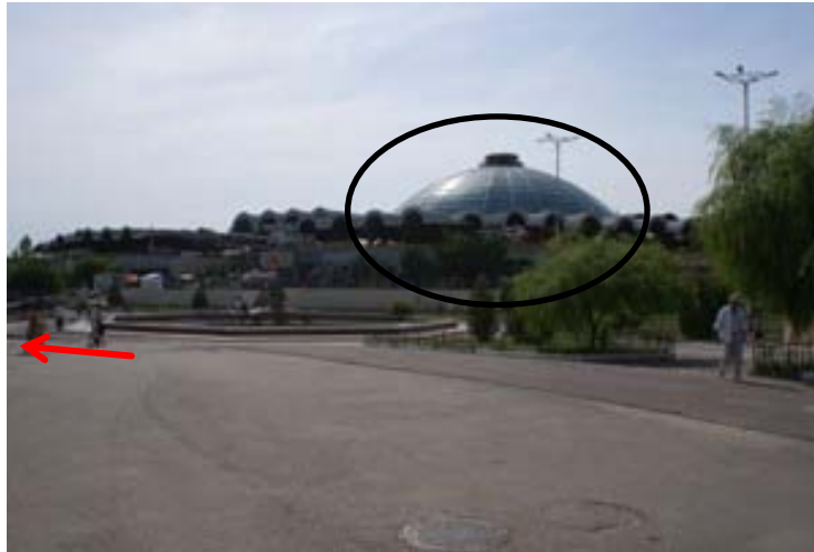
チョルス・バザール

丸い黒枠で囲まれている球状の建物内では、 香辛料・お米・ハチミツ等が売られております。 衣類に関しては画面手前辺り。