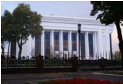
昨年9月に完成した建物

1階のレストランは当たり障りのない料理が多く、 ウズベク料理が苦手という方にはおススメ♪