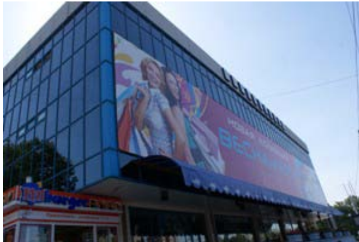
交差点4つ角の一つ、スーパーマーケット

別名「GOLD CENTER」。 そう、 金 を売っております ✧ ✧ また夜間はパチンコ屋を思わせるほど電飾が輝きます。 夜暇だからって立ち寄らないよ〜に！！