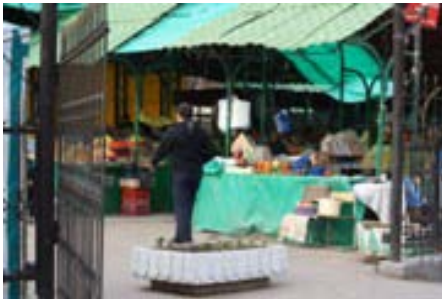
大きくないけど小さくもないバザール

↑のバザールが見えたら、 PLANETA-BISTROまでもうすぐです(*^^*) こちらのバザールは食材がメインですが、 合鍵職人のエエおっちゃん がいます(^^)