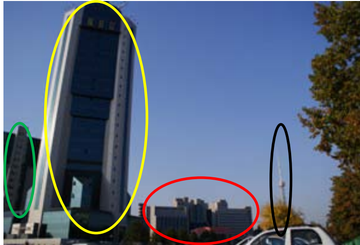
銀行、ビジネスセンター、ホテル