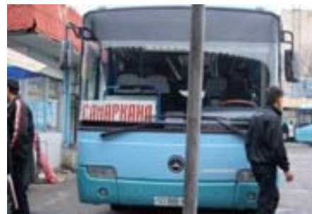
バス(ロシア語:アフーブス)