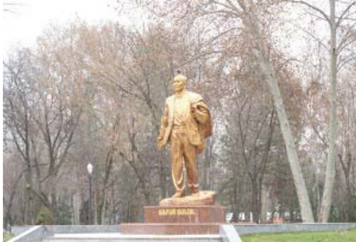
MIRZO ULUG'BEK公園のGafur Gulom像

MIRZO ULUG'BEK駅のすぐ近くに大きな公園がございます。 こちらの公園はアトラクションがメインなため、景観も素晴らしいですが、 夜間はカップルだらけとなります(*^^*)