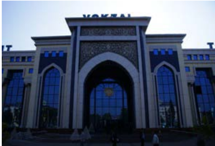
鉄道、タシケント駅