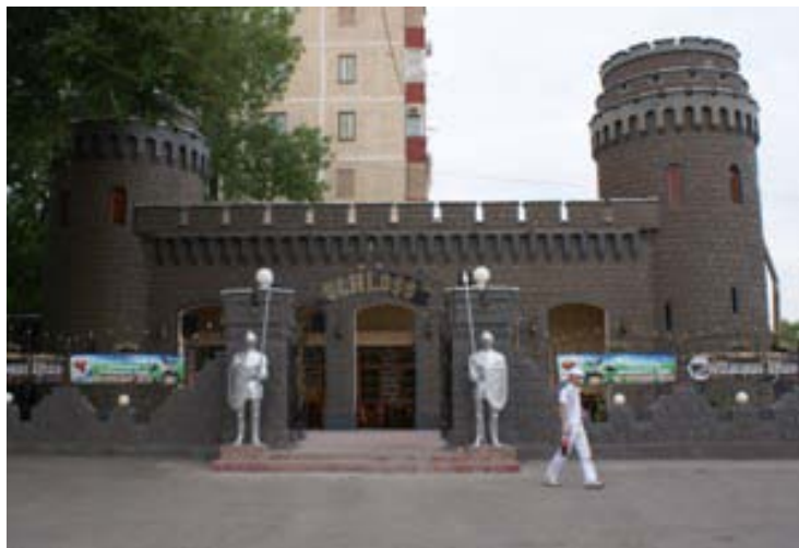
ちょっと可愛いレストラン

黄色矢印方面へ500m程歩くと、右手に↑の並木道が。 赤矢印方面と並行して続いているものと思われます。