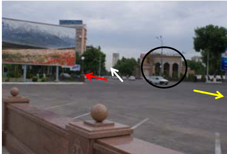
公園正門前 大通り