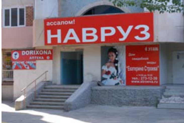
タシケントNo.1カメラマンのフォトスタジオ

こちらフォトスタジオと言っても、 マンションの一室に事務所を構えており、フロアは4階です。