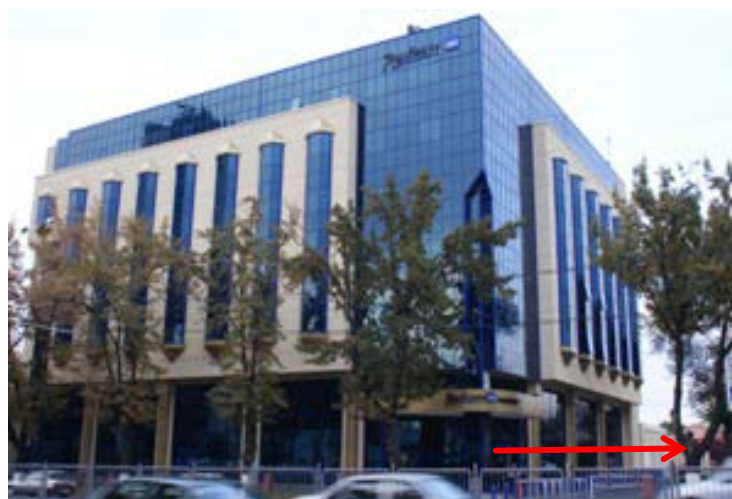
ラディソンSASホテル

タシケントタワーと逆方向に+A1300m程、道路の向かい側に位置します。 かなりサービスの良いホテルと伺っておりますが、詳細は掴めておりません。 ゲスト以外の無線LANに依るインターネットへの接続は、 禁止されております。