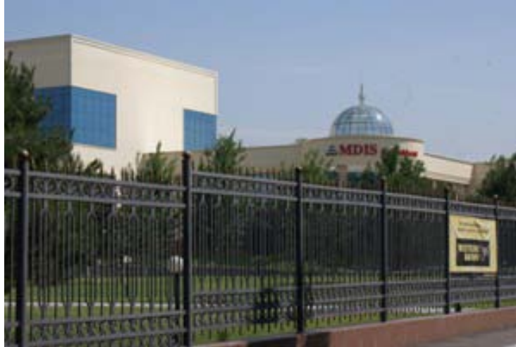
タシケントで最もオマセな大学

マレーシアのある大学の姉妹校。 通常解放されていないので特に紹介する必要もないのですが、 全校生徒英語ペラペ〜ラです。 寧ろ英語が話せないと入学出来ません(ー)