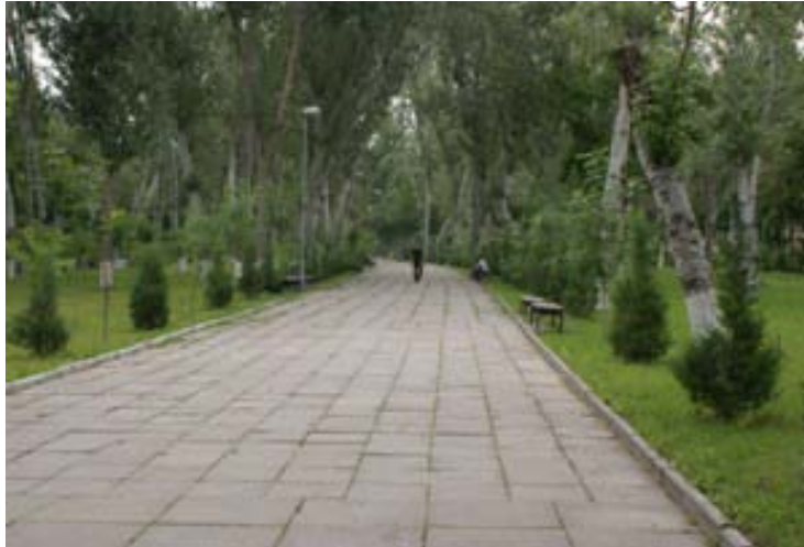
ウズベキスタンホテル方面へ繋がる？道

黄色矢印方面へ500m程歩くと、右手に↑の並木道が。 赤矢印方面と並行して続いているものと思われます。