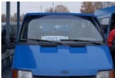
マルシェルートカ

乗ってきたMetroの進行方向 にある出口を目指して下さい。 とにかく前へお進み頂くと、↑写真の様な景色をご覧頂けます。