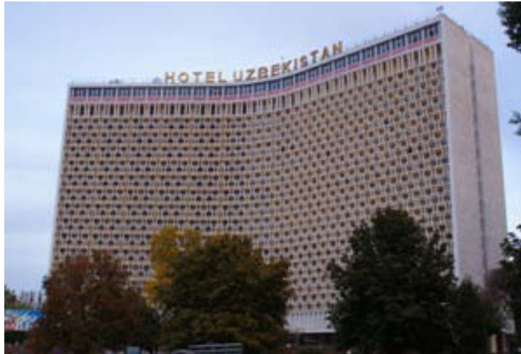
ウズベキスタンホテル

老舗4つ星ホテル。 一泊料金・・・お一人80$～、お二人100$～ 1階レストラン含め、無線LANに依るネット接続可。 但し最近の速度は10kbps前後。 ※パスワード不要