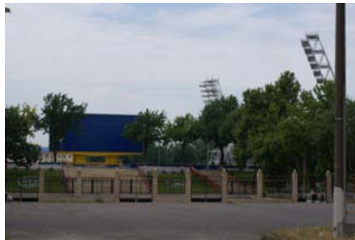
パフタコールスタジアム

博物館をやり過ごし、1km程歩くと左の映画告知ポスターが見え始めます。 次の右へ折れる路地へ入ると100m程で右写真の劇場が。 劇はロシア語で催されますが、私の中では タシケントで一番おススメの場所! 騙されたと思って足を運んでみて下さい。きっと騙されます。笑